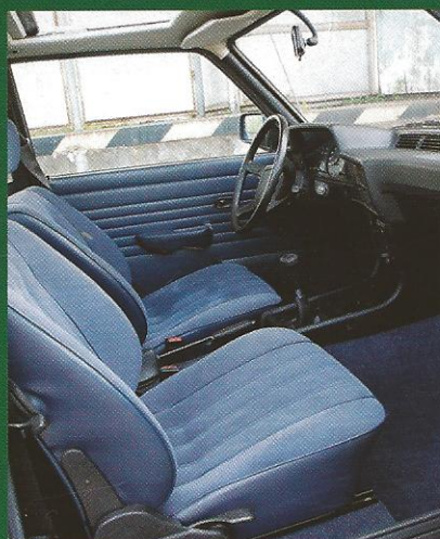
De staat van het interieur, het functioneren van alle voorzieningen en de aanwezigheid van originele accessoires als een schuifdak zijn mede bepalend voor het taxatiebedrag.